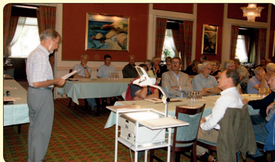
Formanden aflægger beretning

Arbejdet har været udlagt til et konsulentfirma, men pga af besparelser er det nu kommunens forvaltning, der har udarbejdet forslag, som VANDRÅD NORDFYN nu ser på. AHSV har dog for længst udarbejdet egen plan.