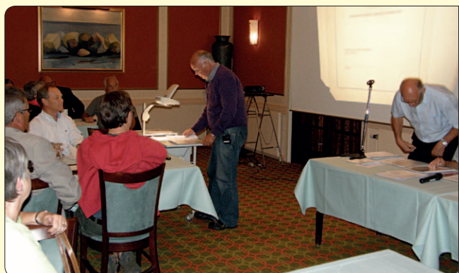
Kasseren forelægger regnskabet

Muligheden for flere måder til indberetning af aflæsningstal forventes. Der vil blive orienteret herom på selvaflæsningskortet.