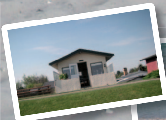
Vores sommerhus 'Jydebo'. Læs historien på side 10 og 11.