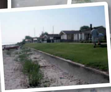
Diget hvor man kan gå lange ture og nyde udsigten til vandet.