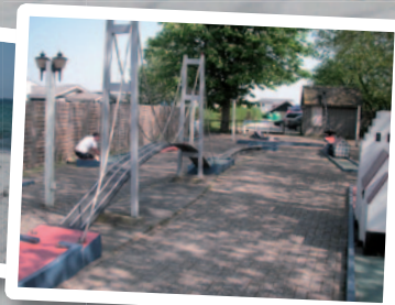
Minigolfbane inspireret af Storebæltsbroen.