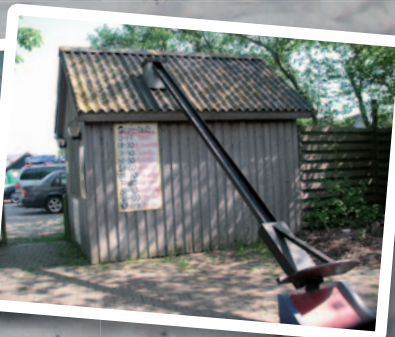
Sidste hul på minigolf- banen, hvor man skal slå bolden op gennem et rør og ned gennem taget, hvor den lander i en spand med bolde som senere bliver ud- leveret til nye spillere.