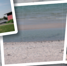
En "sand-ø"ude i vandet, som kommer når det er ebbe.