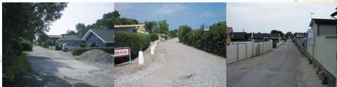
Mod øst til Østerballevej

I 2006 på sydsiden af Vestre Strandvej og i 2007 fra Østerballevej 250 meter mod vest ad Østre Strandvej.